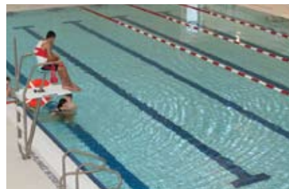
Les travaux de construction ont été terminés et les piscines ont été rouvertes en février 2011.